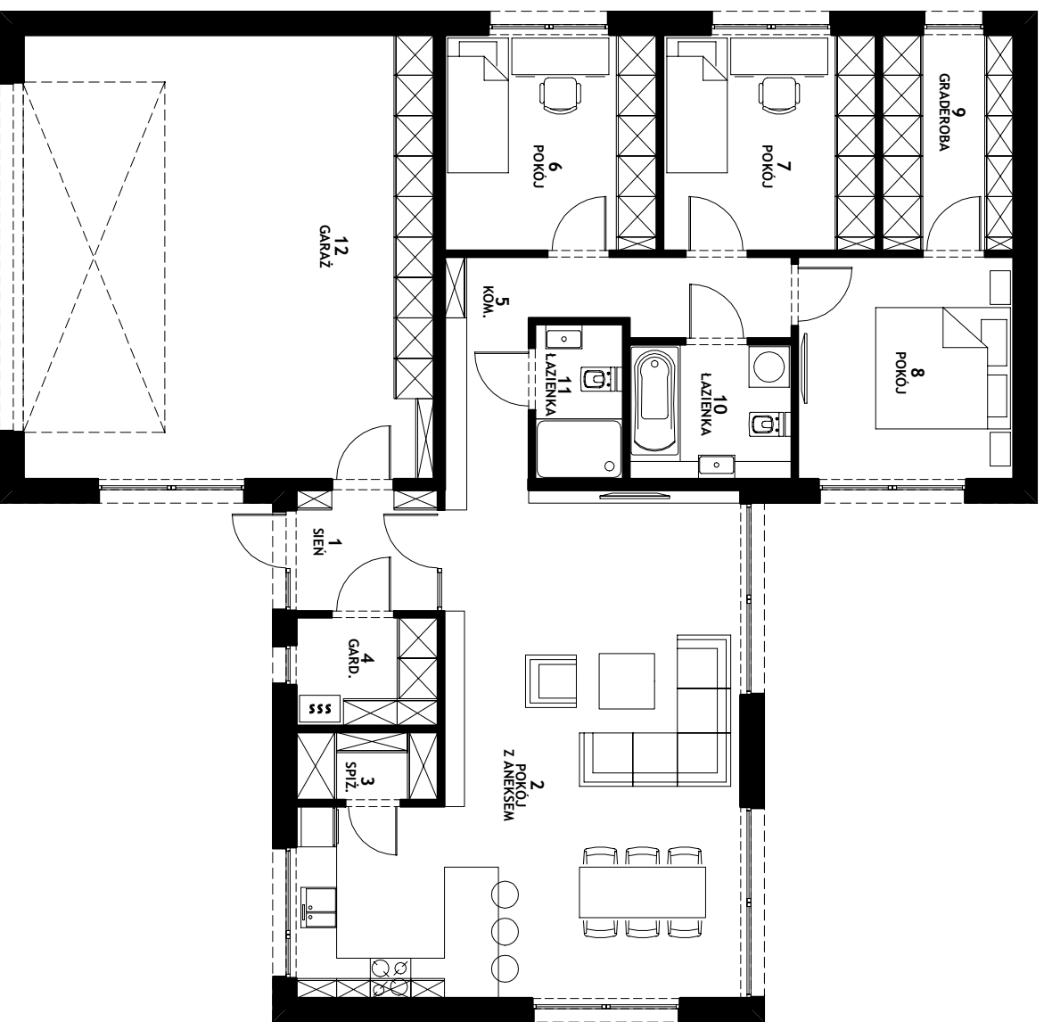
RZUT PARTERU skala 1:100